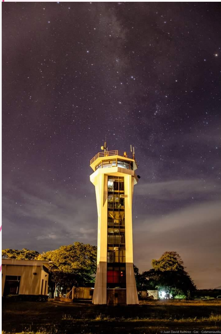
© Juan David Ramirez - Cec - Cosmonautika